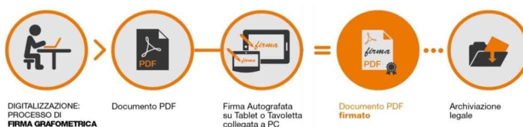
Fig.2 - Schema

I dati cifrati vengono successivamente inseriti nel pdf attraverso la creazione di una firma conforme allo standard europeo denominato PAdES. La soluzione prevede che, a sigillo di ogni firma apposta sul documento dal CLIENTE , sia applicato un certificato rilasciato da NAMIRIAL CA.